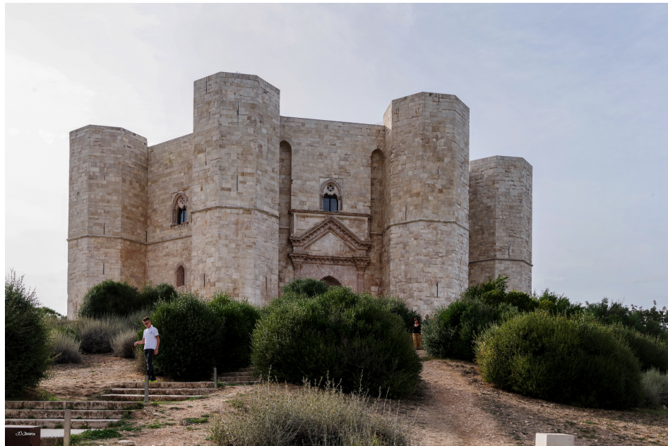
Castel del Monte