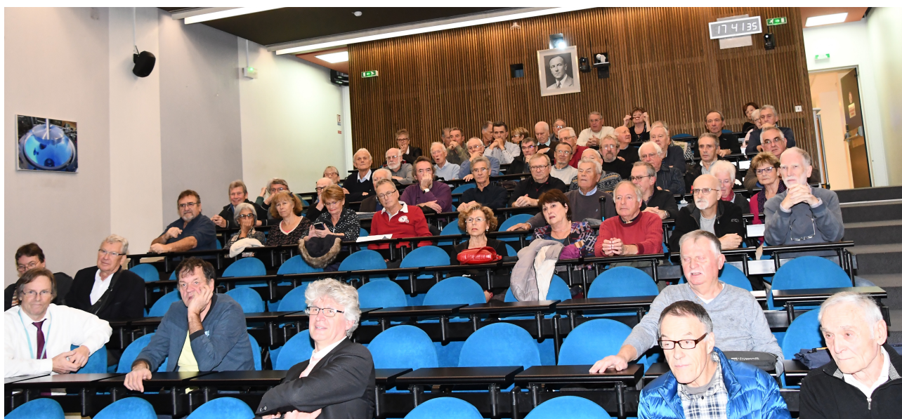
Photo de l'Assemblée Générale