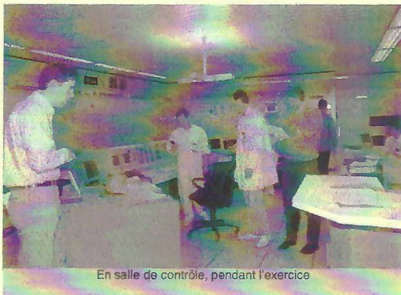
En salle de contrôle, pendant l'exercice

Pour tester le plus largement possible les réactions aux événements, le scénario prévoyait contre toute vraisemblance une cascade d'accidents ... :